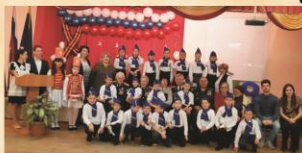
ОБОРОННО-МАССОВАЯ И ВОЕННО-ПАТРИОТИЧЕСКАЯ РАБОТА

В школе работает исторический музей «Исток» проводятся: экскурсии, встречи с ветеранами ВОВ, воинами- интернационалистами, военнослужащими воинской части, уроки Мужества.